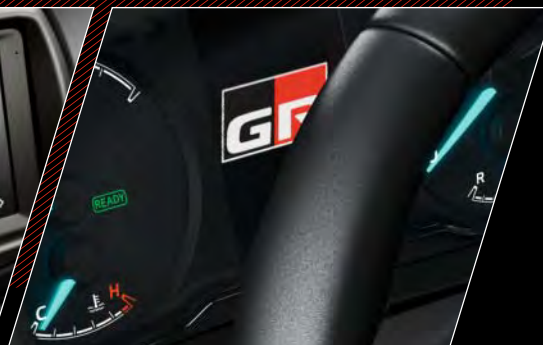
2. Føreinformations display i farve med GR SPORT startskærm

Smartphoneintegration er kompatibel med Apple CarPlay™. Din telefon skal tilsluttes via USB. Apple CarPlay™ fås til iPhone 5 og derover. Apple CarPlay™ er et registreret varemærke tilhørende Apple Inc.