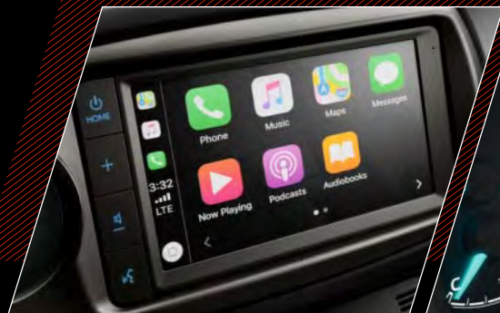
1. Multimediesystem med smartphoneintegration

Velkommen i en kabine designet til at få blodet til at rulle lidt raskere. Læn dig tilbage i GR SPORT-sæderne, læg hænderne på det racerprægede rat og glæd dig til bedste: Køreoplevelsen. Et intelligent multimediesystem med smartphone-integration og seks højttalere gør turen endnu mere underholdende. I kombination med Apple CarPlay™ (billede 1 herunder) kan du spejle brugerfladen på din iPhone og tilgå dine apps på den intuitive 7" touch screen, så du har nem adgang til navigation, underholdning og kommunikation.