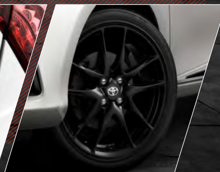
17" sorte alufælge