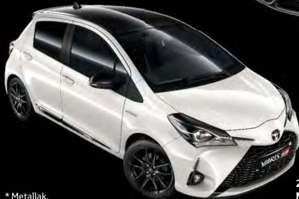
2NR Pure White / Night Sky Black tag*