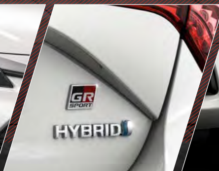
GR SPORT emblem