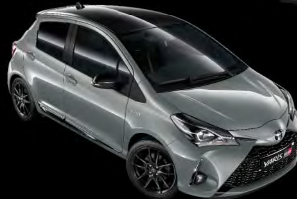
2QS Manhattan Grey* / Night Sky Black tag*